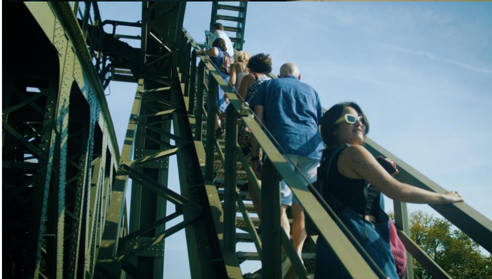
Ook publiekslieveling De Hef is weer van de partij. Wie een gratis plekje weet te reserveren, klimt tijdens het Rotterdamse monumentenweekend tot in de machinekamer.