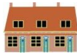
Illustraties: Caroline Ellerbeck